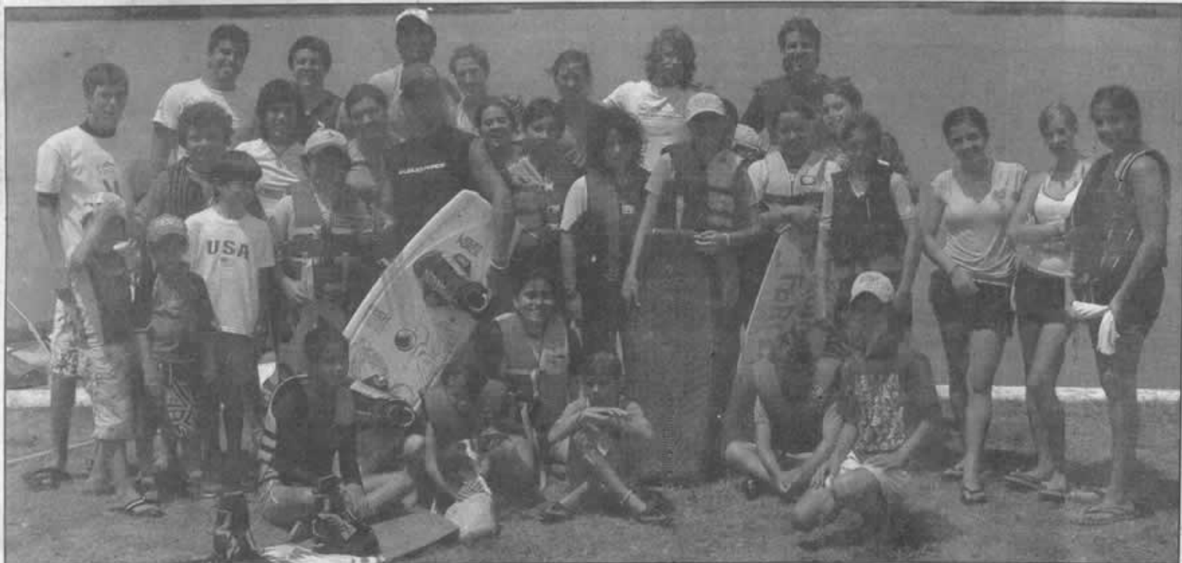
EN LAS TRANQUILAS aguas de la Laguna del Chairel es donde diariamente practican los alumnos de Tampico WakeAm School.

los deportistas con espíritu aventurero que buscan practicar un deporte extremo, que los ponga directamente en contacto con la naturaleza y los haga ver su naturaleza física, toda vez que los hará poner en práctica todas sus habilidades y destrezas para dominar este deporte acuático.