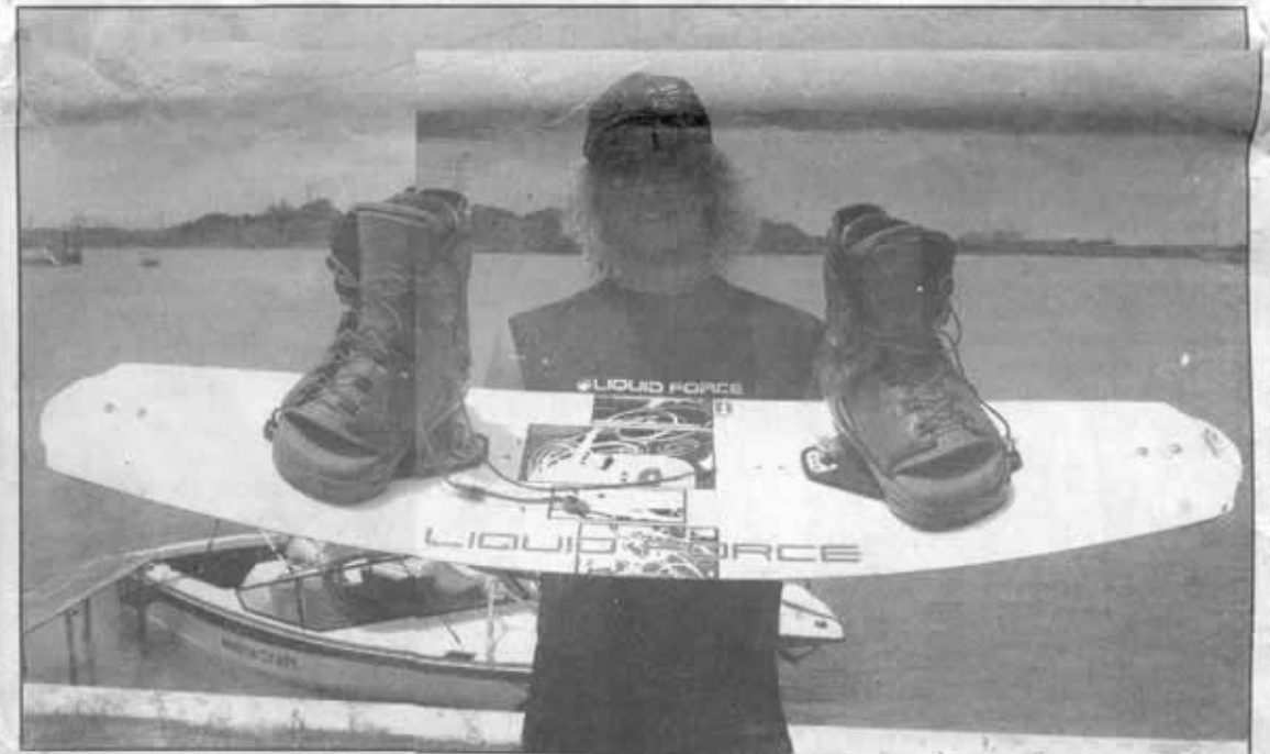
ESTE DEPORTE toma su nombre del tipo de tabla que se utiliza para su práctica, en la cual sus participantes se convierten en verdaderos jinetes del agua.

Gochicoa, es hoy por hoy la número uno en México y cuenta con los elementos necesarios para eso, es la que más alumnos tiene en todo el país, tiene dos lanchas equipadas para la práctica y desarrollo de este deporte, es manejada por instructores profesionales que han destacado a nivel internacional y so-