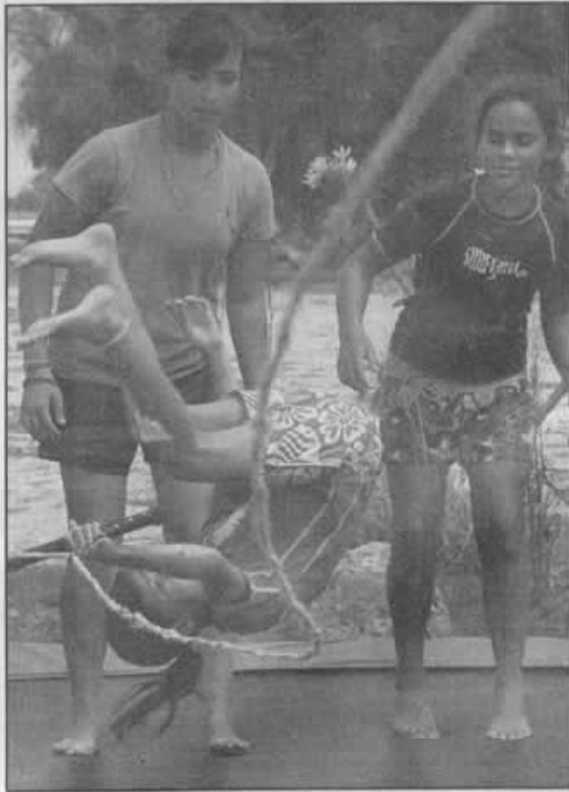
EL TOMBLING es otro de los ejercicios que ayuda a practicar y aprender los saltos y giros básicos del Wakeboard.

los giros con grados de dificultad, como el giro de 360 grados o frontales, se utiliza un tomling que simula la turbulencia del agua y