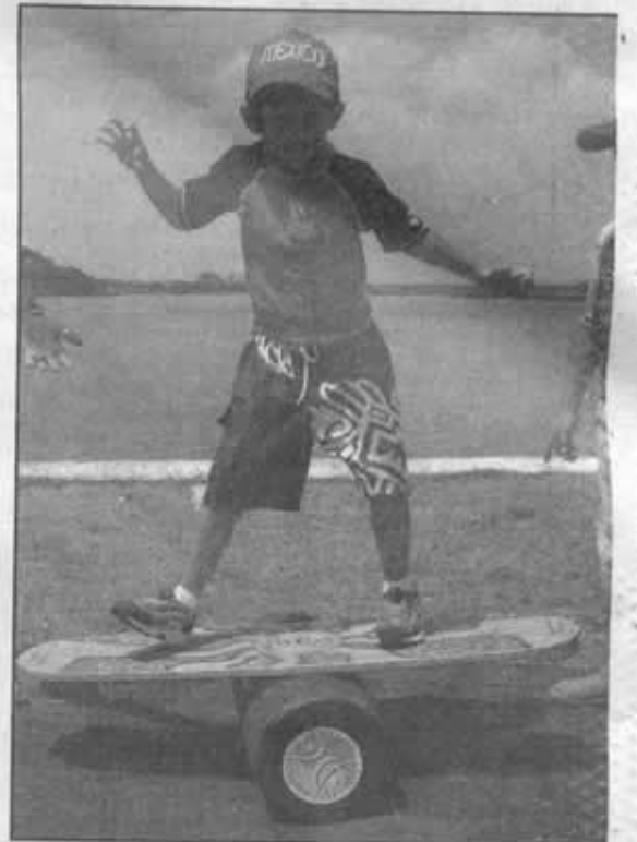
EL WAKEBOARD es un deporte extremo del cual su práctica comienza en tierra con ejercicios como el Indo Board que ayuda a dominar el equilibrio.

La práctica del wakeboard en nuestro puerto es una excelente opción para todos